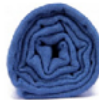
PASHMINA Océan L'écharpe bleu, le naturel et élégant, le bleu d'une belle nuit. 49€