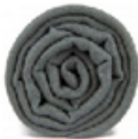
PASHMINA ANTIHILARITE L'écharpe gris anthracite, le classique, chic et intemporel. 49€