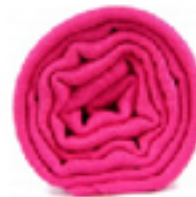
PASHMINA FLEAMBOIS L'écharpe rose fuchsia, délicate et efficace, bonne mine garanti. 49€