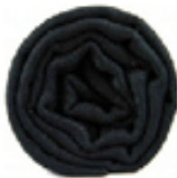
PASHMINA TÉTRASSE L'écharpe noire, le grand classique, élégance, mode et style d'élite. 49€