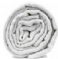
PASHMINA NAPPÉE L'écharpe blanche, le grand classique pour mariage et cérémonie. 49€