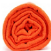
PASHMINA CLÉMENTINE L'écharpe orange, le naturel dynamique pour un look urbain. 49€