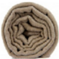
PASHMINA L'AUVE L'écharpe beige, le naturel, élégant et d'une douceur unique. 49€