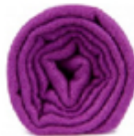
PASHMINA AUSTROBOIS L'écharpe violette, une couleur royale, une douceur unique. 49€