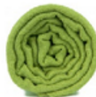
PASHMINA AUNE L'écharpe verte, le naturel et élégant, un style ultra moderne. 49€