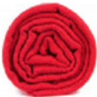
PASHMINA ANGOIS L'écharpe rouge, dynamique et charoyante, un accent de charme. 49€

Pashmina et Cachemire c'est juste une toute petite équipe, des gens ordinaires, qui ont imaginé un monde tout en douceur. De voyage en découvertes, nous avons parcouru l'orient et déniché ses trésors secrets: le châle pashmina et la laine cachemire!