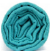
PASHMINA TURQUOISE L'écharpe bleu, au style cool et trendy, dans un bleu doux. 49€