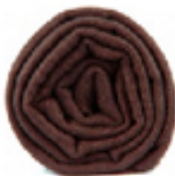
PASHMINA CHOCOLAT L'écharpe marron, le naturel, naturel d'une douceur évidente. 49€